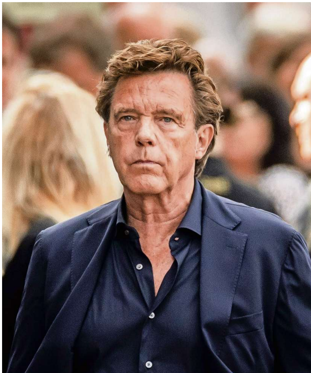
John de Mol schuwt het innoveren en het nemen van risico's niet.

De complete lijst met de 75 meest invloedrijke mediamakers uit de Nederlandse tv-geschiedenis is te lezen op spreekbuis.nl .